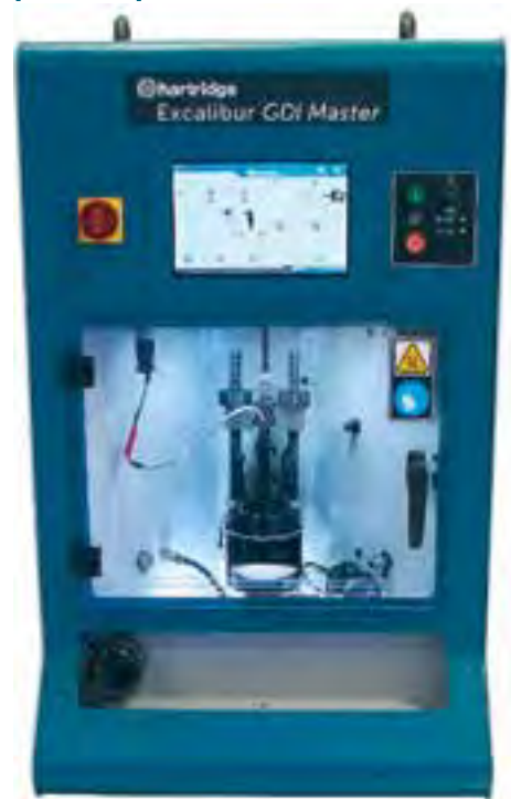
Model testowy wzoru dyszy