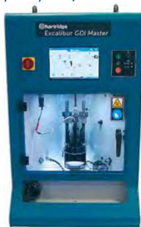
Model testowy wzoru dyszy